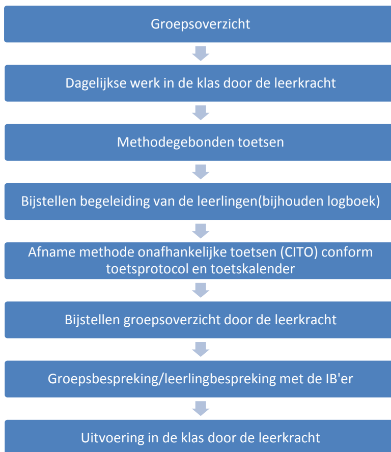
Figuur 2. Overzicht ondersteuningsstructuur

andere, beter passende plaats zoeken. Dat kan ook het speciaal (basis)onderwijs zijn. Ook hierin worden ouders tijdig meegenomen.